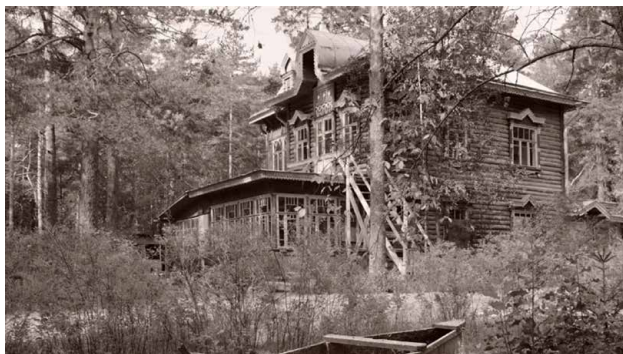
Schostakowitsch Datscha in der Künstlerkolonie Komarovo

«Ich versuche, eine Symphonie [= Sinfonie Nr. 10] zu schreiben. Obwohl mich niemand bei der Arbeit stört, komme ich nur mittelmäßig voran. Wenn die «schöpferische Kraft» einen hohen Grad erreicht, kann mich nichts an der Arbeit hindern. Wenn sie aber auf einer mittleren oder gar niedrigen Stufe ist, dann können mir weder die Erholungsheime des Komponistenverbandes noch sonst irgendwelche Bequemlichkeiten helfen ... Vorerst bin ich dabei, unter Schwierigkeiten den ersten Satz zu beenden. Wie wird es weitergehen? Ich habe keine Ahnung.»