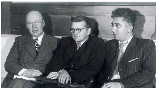
Sergej Prokofjew. Dmitri Schostakowitsch, Aram Khachaturian